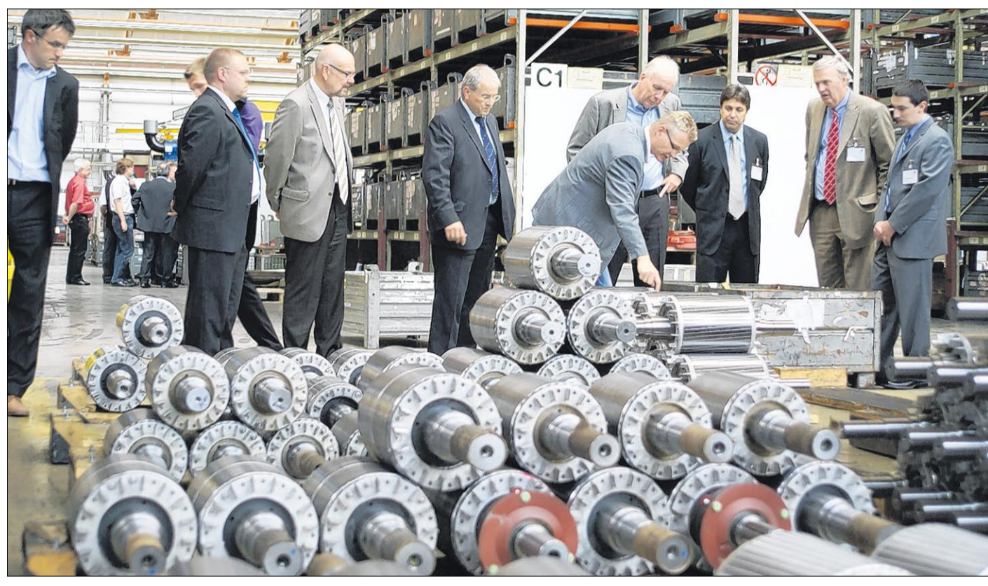
Nach zwei Tagen intensiven Fachaustauschs von 200 Experten aus 13 Ländern zum Thema „Energieeffizienz – Herausforderungen an die Antriebstechnik“ bildete ein Werksbesuch bei VEM motors in Wernigerode den Abschluss des 9. „Technischen Tages“.

Finalisten bildet. Jene vier Betriebe erhalten dann die Gelegenheit, den Jurymitgliedern ihre Bewerbung in der Praxis zu erläutern. Danach wird das Gremium entscheiden, wer am 3. September auf Schloß Wer-